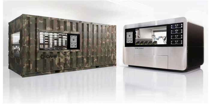
Bild: CA-M Series 1 (Defense, links), CA-1 Series 4 (Commercial, rechts)